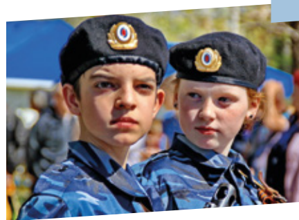
Юные друзья полиции