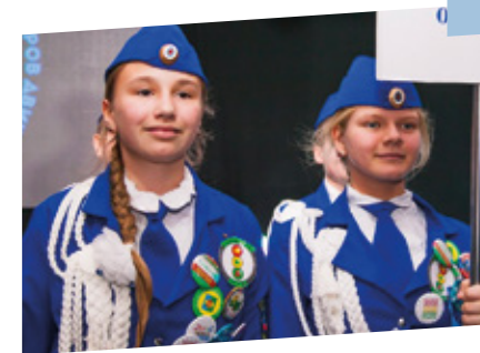
Юные инспектора движения