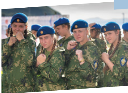
Курсанты военно-патриотического центра «Вымпел»