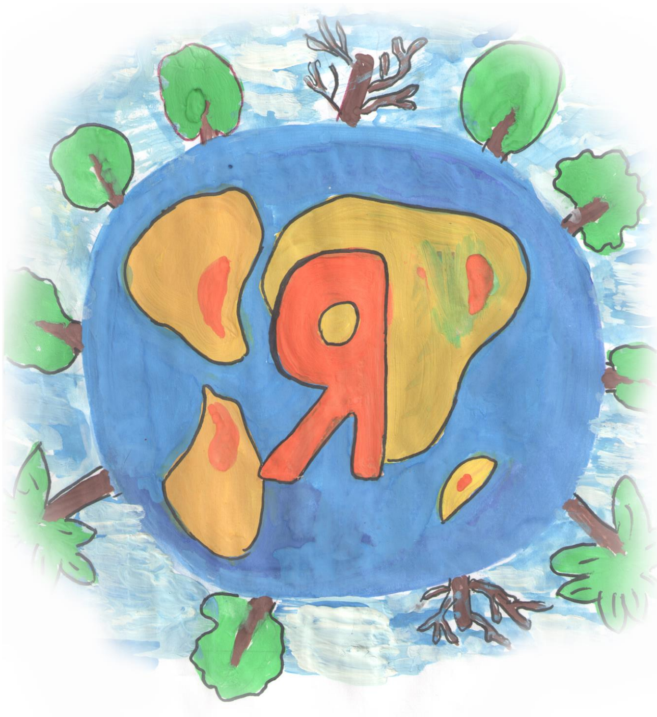
Рисунок Алёны Медведевой, 12 лет, г. Братск Иркутской области