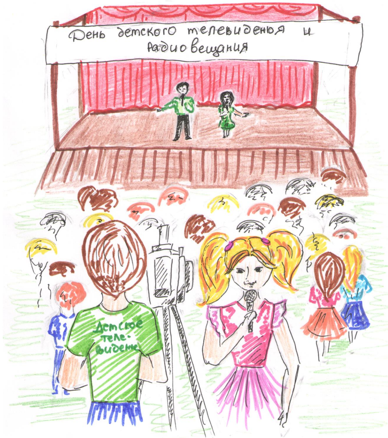
Рисунок Анны Козловой, 14 лет, г. Великий Новгород

ОСТАВАЙСЯ НА СВЯЗИ! Идеи дел для информационно-медийного направления РДШ