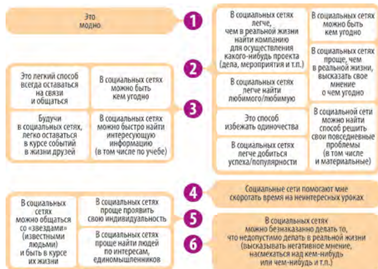
Рис. 5. Кластеры мотивов.

При этом мотивы делятся на определенные группы кластеров (от англ. cluster — скопление, кисть, рой — объединение нескольких однородных элементов, которое может рассматриваться как самостоятельная единица, обладающая определёнными свойствами):