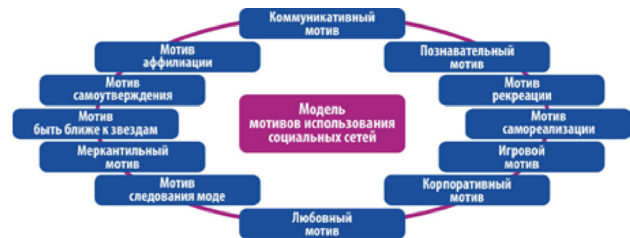
Рис. 4. Мотивы использования социальных сетей