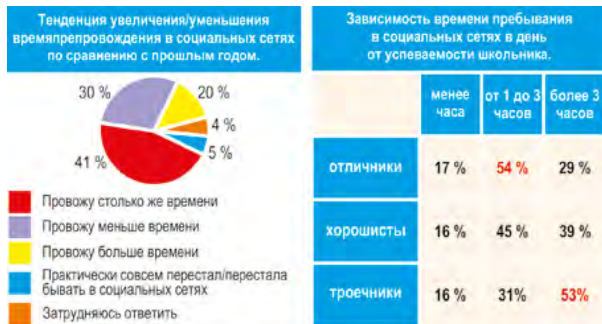
Рис. 3. Некоторые временные тенденции.

тером деятельности в интернете, хотя встречались и расхождения. Например, четвертая часть тех, кто относил себя к пользователям, создавали и размещали свой контент, что является творческой деятельностью. Критикой, спорами, издевательствами в комментариях занимаются не только бунтари и террористы, но и представители других групп, даже те, кто считают себя гражданами цифрового мира.